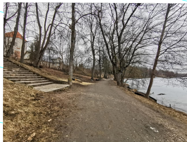
Laiptai į bažnyčią