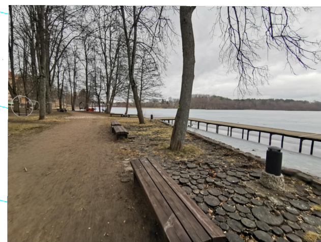
Poilsio aikštelė su suolais ir liepteliu Danga iš medienos (medžio kamienų)