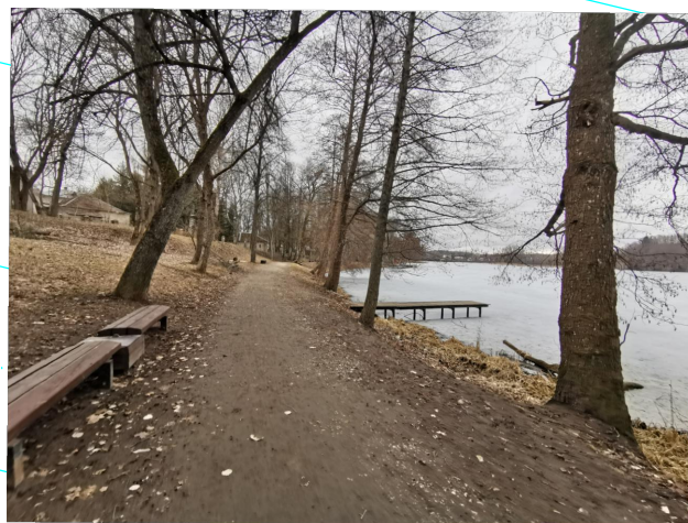
Poilsio aikštelė su liepteliu