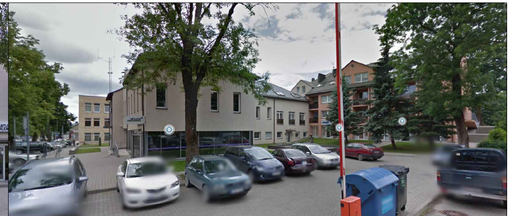
VAIZDAS IŠ AUTOMOBILIŲ AIKŠTELĖS PUSĖS