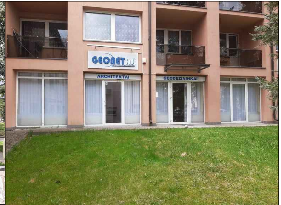
PATALPŲ VIETA PASTATE