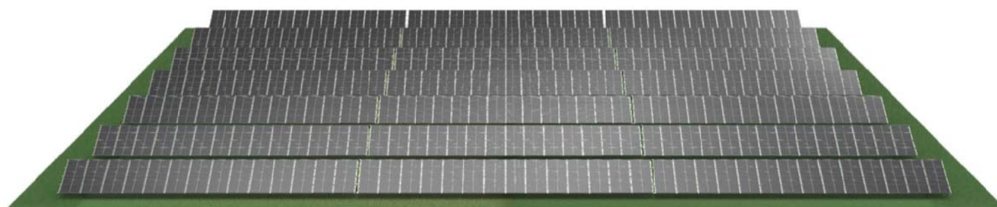
VIZUALIZACIJA - 3.