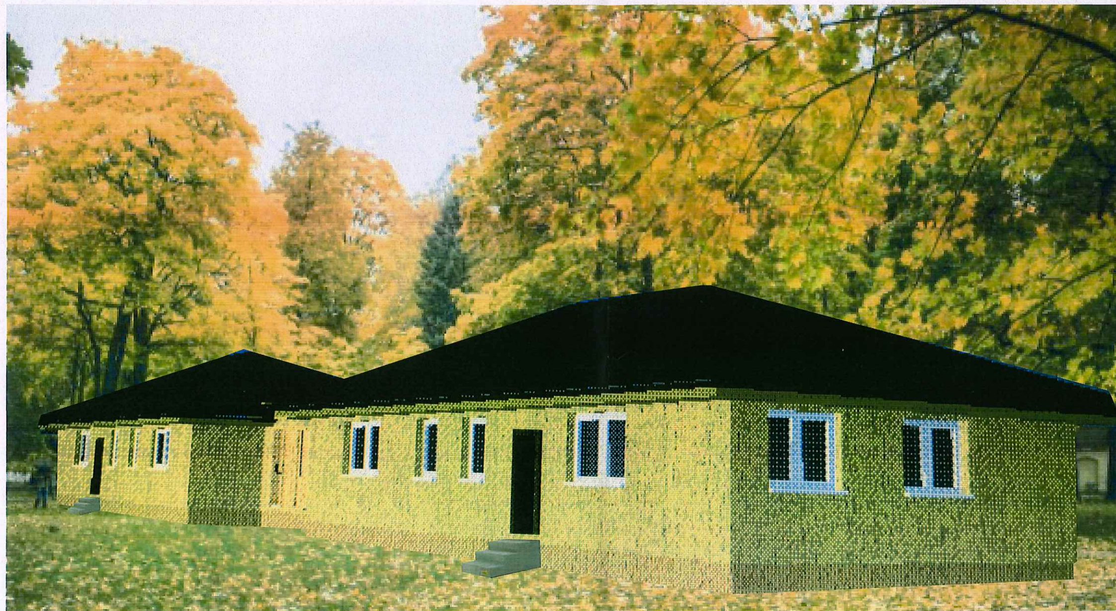
PROJEKTUOJAMO PASTATO VIZUALIZACIJA