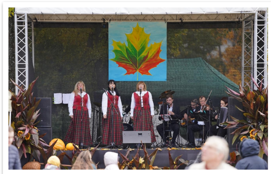
11 lentelė / paveikslas

Kolektyvas puikiai pasirodė respublikiniame festivalyje „Piesni z nad Wilji“, vykusiame Vilniaus lenkų namuose. Tęsdami tradicijas, organizavo ir kaip dalyviai, pasirodė festivalyje „Dwięcz Polska Piesni“ Lentvaryje, muzikinę programą atliko ir Trakų miesto šventėje „Trakų vasara 2022“.