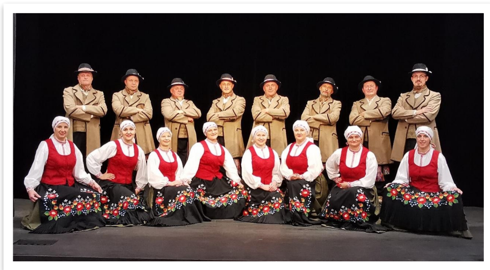
14 lentelė / paveikslas

Šokėjų credo: „Šokių pynę mes nupinsim, tėviškėlę padabinsim“.