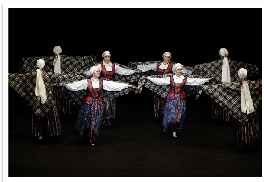
8 lentelė / paveikslas

Pagrindinis grupės tikslas – tai tinkamai pasiruošti artėjančiai 2024 metų Lietuvos Dainų šventei. Didžiausia koncertinė programa ir kūrybinė veikla numatoma Trakų miesto šventėje „Trakų vasara 2023“, taip pat ruošiami atnaujinti koncertiniai pasirodymai respublikiniam liaudiškų šokių festivaliui „Subatos vakarėly“ Kaišiadoryse bei respublikiniam moterų liaudiškų šokių konkursui Vilkaviškyje.