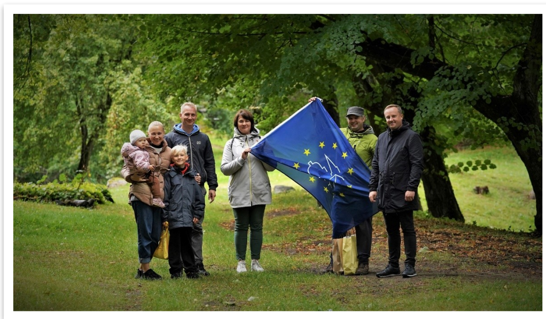
26 lentelė / paveikslas

Europos paveldo dienų šventę Lentvaryje tradiciškai pabaigė orientavimosi sporto žaidimas Encounter orientacinės varžybos. Žvarbaus ir lietingo sekmadienio oro nepabūgusias žaidėjų komandas, atvykusias iš Trakų, Vilniaus ir Lentvario miestų, sudarė jaunos šeimos su vaikais. Komandos, įveikusios visą maršrutą, pasiekė finišą ir susitiko Lentvario istoriniame parke stūksančios didžiosios grotos.