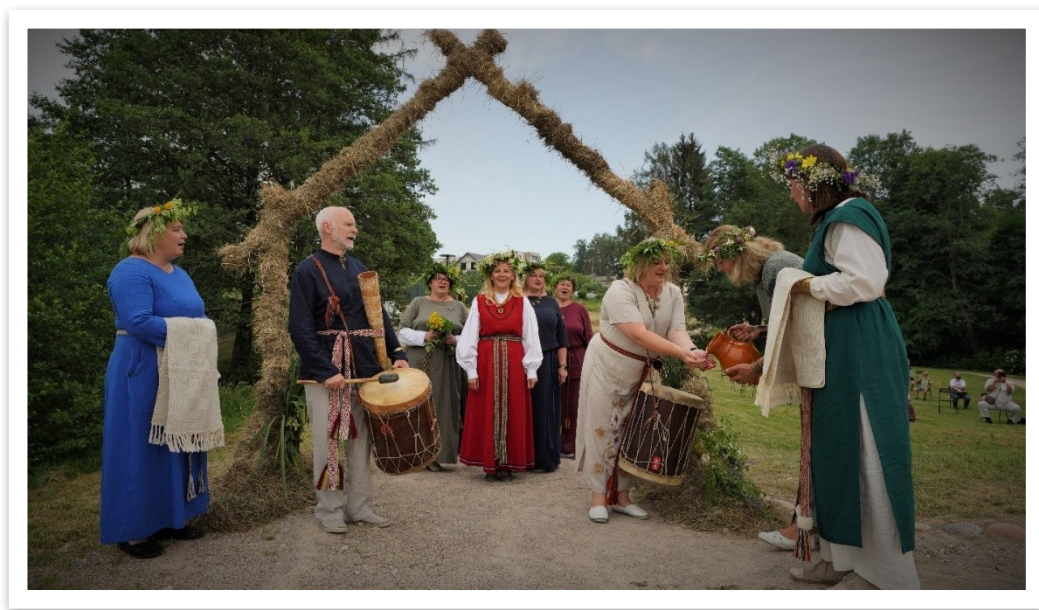
7 lentelė / paveikslas

2023-ais metais kolektyvas planuoja atnaujinti folklorinę programą ir ją pristatyti miesto bei rajono renginiuose. Ketina betarpiškai bendradarbiauti su kitų miestų mėgėjų meno kolektyvais.