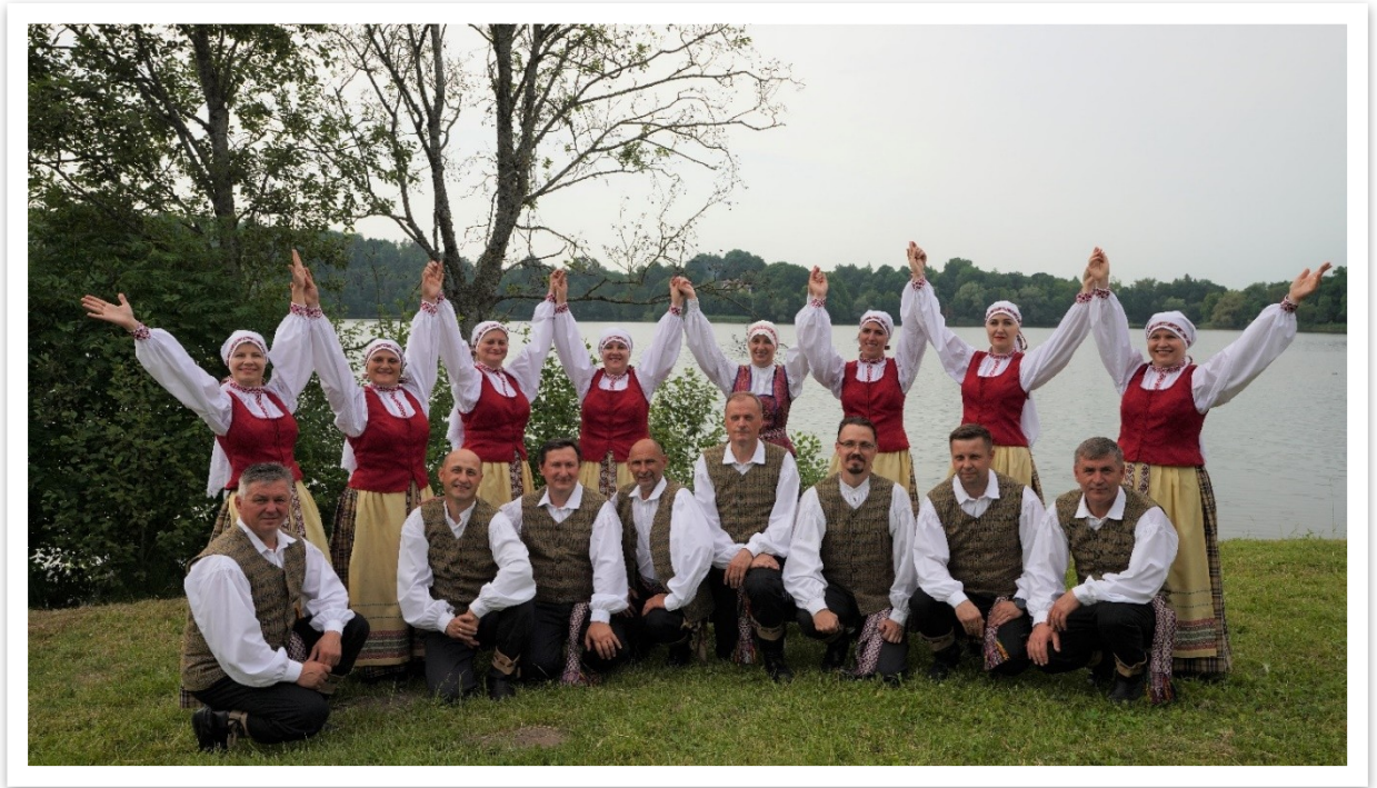
5 lentelė / paveikslas

Lentvario kultūros rūmų vyresniųjų liaudiškų šokių grupės „LENDVARĖ“ vadovė yra Lentvario kultūros rūmų etatinė darbuotoja.