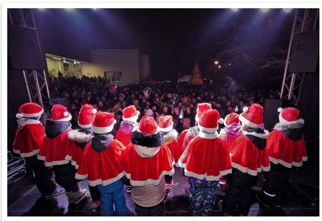
25 lentelė / paveikslas