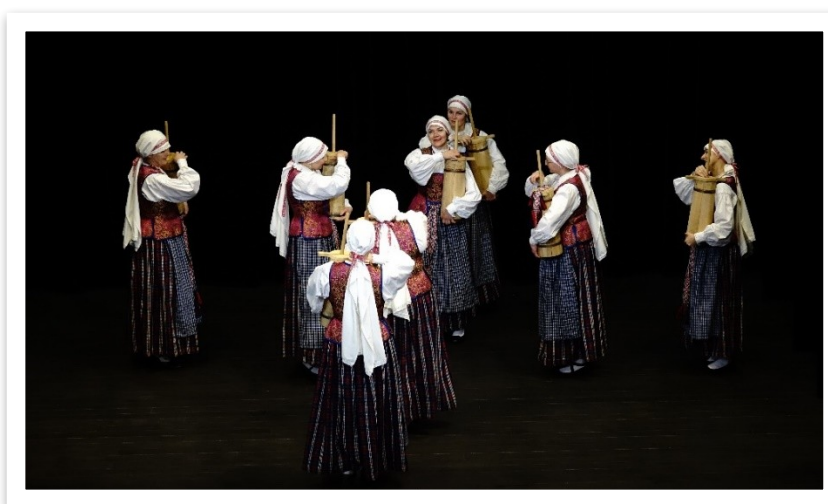
16 lentelė / paveikslas

Artėjant Vasario 16-ajai, džiaugiamės, galėdami planuoti gyvą Lietuvos valstybės atkūrimo dienai skirtą renginį – šventinį koncertą „Vienybės žiedas“. Šventėje koncertavo Lentvario mėgėjų meno kolektyvai, o patriotines eiles deklamavo aktyvūs miesto jaunuoliai. Vos tik atšventus Lietuvos valstybingumo pradžią, suskubome organizuoti etnografinį renginį – vakaronę „Lygiadienio belaukiant“. Tradicinis renginys, puoselėjamas Lentvario folkloro ansamblio „Volunga“ ir liaudies dainų kolektyvo „Klevinė“, buvo kupinas šilto bendravimo ir melodingo dainavimo, kviečiančio saulę į mūsų namus.