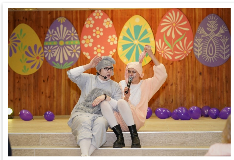
18 lentelė / paveikslas

Palydėję balandį šokio žingsneliu, gegužę pasitikome muzikos garsų sąskambiais. Balandžio 29 d. Lentvario kultūros rūmų erdvės buvo pilnos žiūrovų šypsenų, juoko bei plojimų, skirtų jaunimo muzikos ir šokių šventės „Batų natos“ dalyviams. Tądien koncertiniai pasirodymai buvo skirti ne tik Tarptautinei šokio dienai atminti, tačiau ir paskelbti simbolinį startą Lietuvos jaunimo metų renginių maratonui Lentvaryje. Simbolinis, nes tą pačią dieną vyko nacionalinis jaunimo metų atidarymas Vilniuje. Nuaidėjus Lentvario kultūros rūmus sudrebinusiai jaunimo šventei, gegužę pasitikome klasikinės gitaros muzikos akordais, dedikuotais mūsų artimiausiam žmogui – mamai. Lietuvoje mamas ir močiutes sveikiname pirmąjį gegužės sekmadienį, o šiais metais ši šventė sutapo ir su pirmąja gegužės diena.