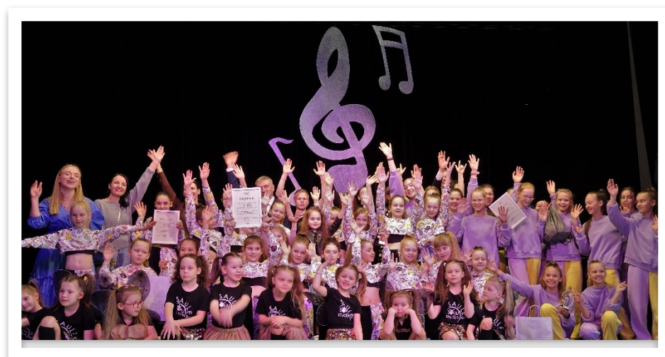
19 lentelė / paveikslas

Palydėję balandį šokio žingsneliu, gegužę pasitikome muzikos garsų sąskambiais. Balandžio 29 d. Lentvario kultūros rūmų erdvės buvo pilnos žiūrovų šypsenų, juoko bei plojimų, skirtų jaunimo muzikos ir šokių šventės „Batų natos“ dalyviams. Tądien koncertiniai pasirodymai buvo skirti ne tik Tarptautinei šokio dienai atminti, tačiau ir paskelbti simbolinį startą Lietuvos jaunimo metų renginių maratonui Lentvaryje. Simbolinis, nes tą pačią dieną vyko nacionalinis jaunimo metų atidarymas Vilniuje. Nuaidėjus Lentvario kultūros rūmus sudrebinusiai jaunimo šventei, gegužę pasitikome klasikinės gitaros muzikos akordais, dedikuotais mūsų artimiausiam žmogui – mamai. Lietuvoje mamas ir močiutes sveikiname pirmąjį gegužės sekmadienį, o šiais metais ši šventė sutapo ir su pirmąja gegužės diena.