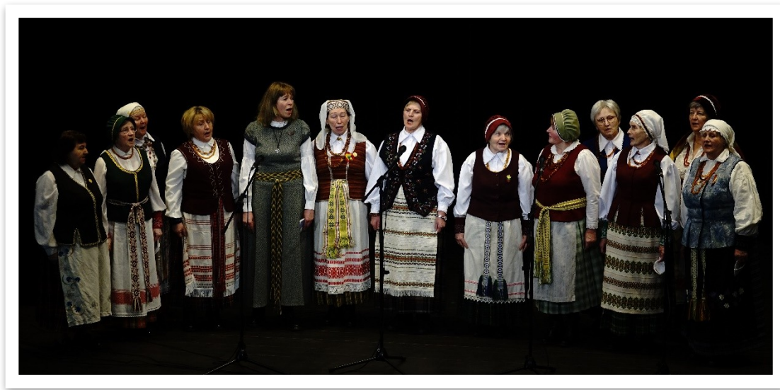
6 lentelė / paveikslas

Kolektyvas ketina ir toliau aktyviai tęsti savo meninę ir kultūrinę veiklas, dovanoti žiūrovams daugybę skambių liaudies dainų, dalyvaujant ne tik Lentvario kultūros rūmų renginiuose, bet ir rajoninėse, regioninėse, respublikinėse šventėse. Kolektyvas planuoja tęsti betarpišką bendradarbiavimą su Lentvario folkloro kolektyvu „Volunga“ ir dalintis gerąja patirtimi.