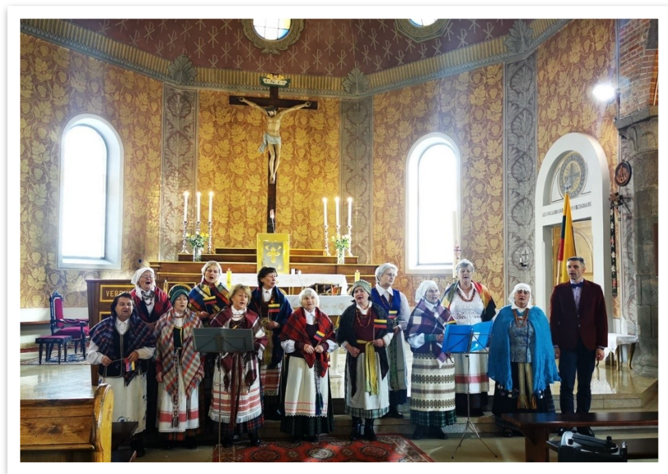
9 lentelė / paveikslas

2022-iais metais choras „Viltis“ aktyviai dalyvavo Lentvario kultūros rūmų atmintinų dienų minėjimo renginiuose. Pasirodė Sausio 13-osios, Vasario 16-osios, Gedulo ir vilties bei Valstybės dienos minėjimuose. Choras yra parengęs ir pramoginę koncertinę programą, kurią atliko lentvariečiams Lentvario Joninių (Rasų) šventėje „Joninių papartis“ ir tradicinėje Lentvario derliaus šventėje.