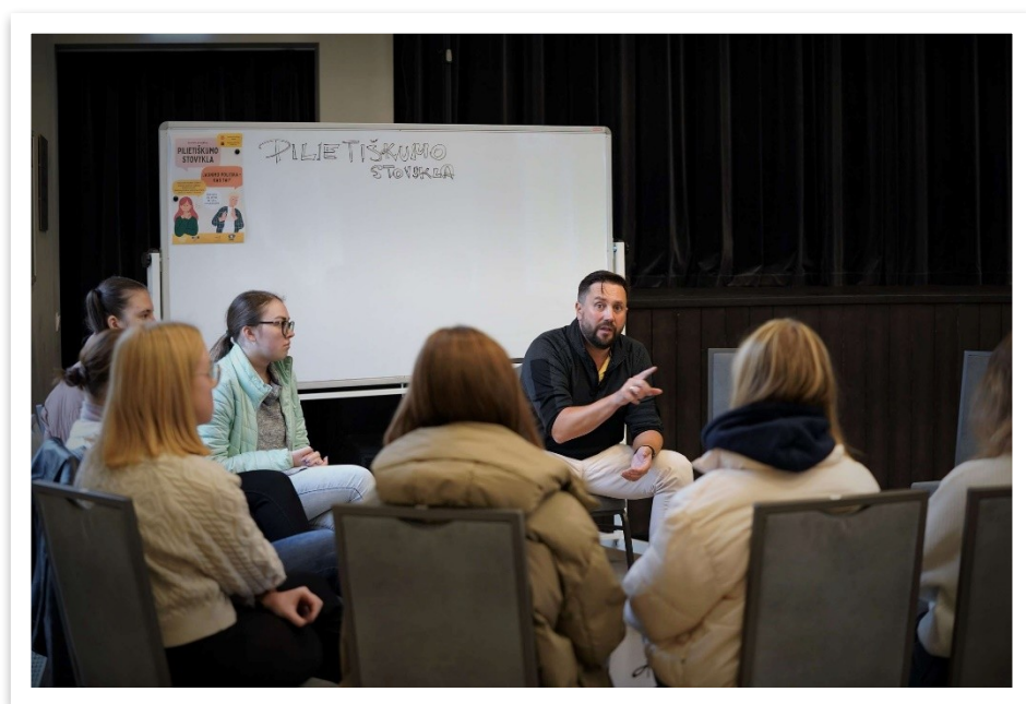
27 lentelė / paveikslas

Trečius metus iš eilės vykstantys skirtingi jaunimo projektai, aktyvus bendradarbiavimas su Lentvario ugdymo ir švietimo įstaigomis, jaunimo organizacijomis ir centrais tik dar kartą įrodo, kad jaunimo įtrauktis į kultūrinę veiklą yra vienas iš svarbiausių Lentvario kultūros rūmų prioritetų.