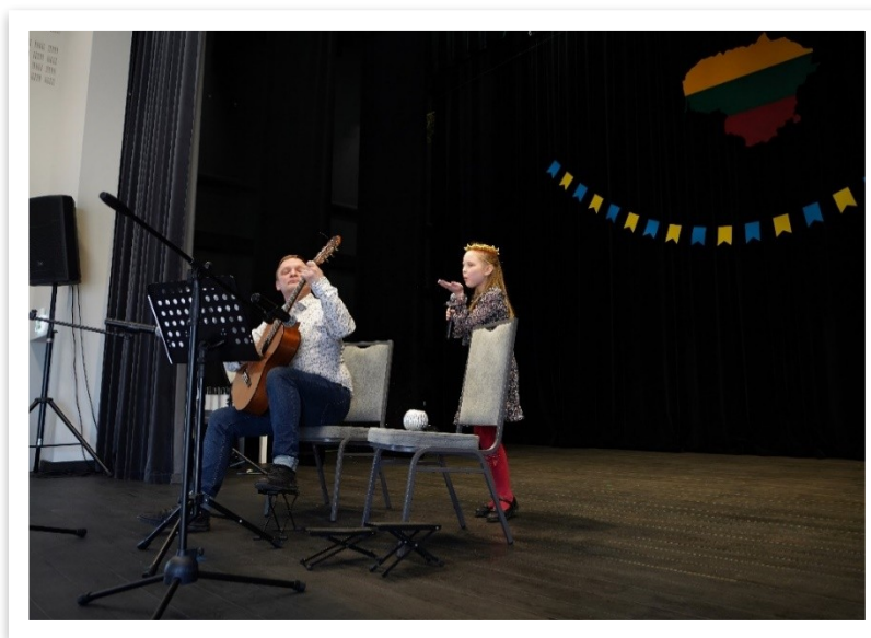
17 lentelė / paveikslas

2022 m. vasario 24-osios naktį Rusija pradėjo karą prieš Ukrainą. Nors ir buvome apimti nevilties bei baimės, tačiau suvokėme, kad reikia padėti nuo karo bėgantiems ir, žinoma, karo alinančioje Ukrainoje likusiems ukrainiečiams. Solidarumą išreiškėme ne tik iškeldami Ukrainos vėliavą, tačiau ir pritaikydami savo kultūrinę veiklą naujiems mūsų bendruomenės nariams. Kovo 11-ąją minėjome Lietuvos nepriklausomybės atkūrimo ir solidarumo su Ukraina dieną, o, kiek vėliau, organizavome ir nemokamą ukrainietišku filmų maratoną. Nepaisant to, džiaugiamės, kad galėjome prisidėti, savo patalpas pritaikant paramos, skirtos Ukrainai, rinkimui.