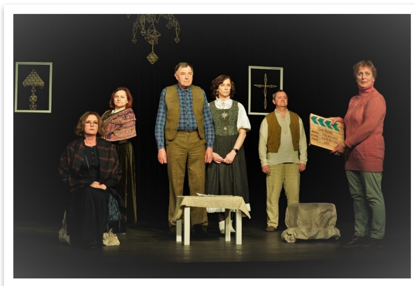
12 lentelė / paveikslas

2023-aisiais metais režisierius su trupe planuoja plėsti spektaklių repertuarą, numatyta ir Lentvario Dvaro teatro spektaklio „Ieškokite moters“ premjera, pastatyta, remiantis prancūzų dramaturgo Roberto Tomo La Perrucheio pjese „Papūga ir višta“. Suplanuotos gastrolės į Grigiškių kultūros centrą, Kauno karininkų įgulos kultūros rūmus, Paluknio seniūniją bei Rūdiškių kultūros centrą.