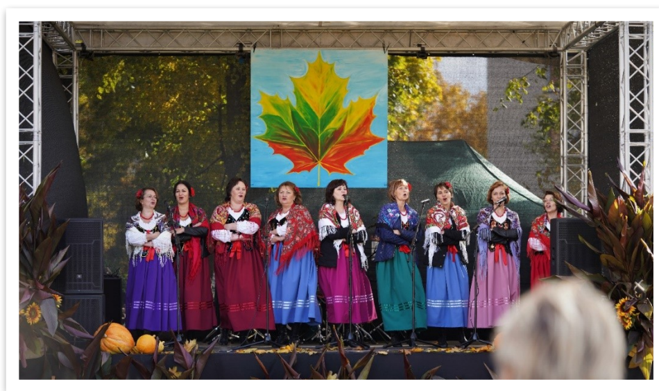
10 lentelė / paveikslas

Vokalinis ansamblis „Landwarowianka“ ketina tęsti savo meninę veiklą: numatyta koncertinė veikla Lentvario miesto, Trakų rajono, respublikiniuose bei tarptautiniuose renginiuose. Ansamblis savo pasirodymais žada populiarinti turtingą lenkų tautos kultūrą, liaudies meną bei tradicijas, puoselės istoriškai labai svarbią Vilniaus krašto etnokultūrą, kalbą bei meną.