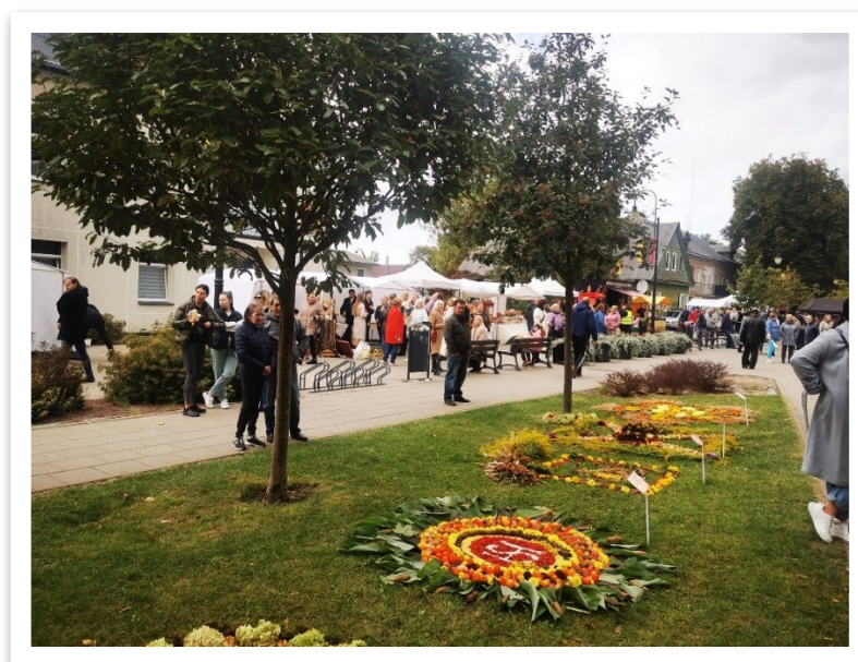
23 lentelė / paveikslas

Ruduo buvo intensyvus ir kupinas kitoniškų bei tradicinių renginių. Kaip ir kiekvienais metais į Lentvarį sugrįžo Europos paveldo dienos ir projektinių veiklų ciklas „Lentvario istorijos vingiai“, kvietęs iš arčiau susipažinti su mieste slypinčiu paveldu bei jo istorine atmintimi. Vos tik pasibaigus vienam renginiui, prasidėjo kitas. Auksaspalvio spalio pradžioje miestiečiai ir svečiai sugūžėjo į Bažnyčios gatvės alėją, kurioje vyko tradicinė Lentvario derliaus šventė ir mėgėjų meno koncertas. Žiūrovų laukė puiki koncertinė programa, šurmulinga rudens gėrybių mugė, Lentvario švietimo įstaigų įrengti kiemeliai, miesto kilimo pynimas, motociklų paroda, vietos ūkininkai bei prekybininkai ir kitos linksmybės.