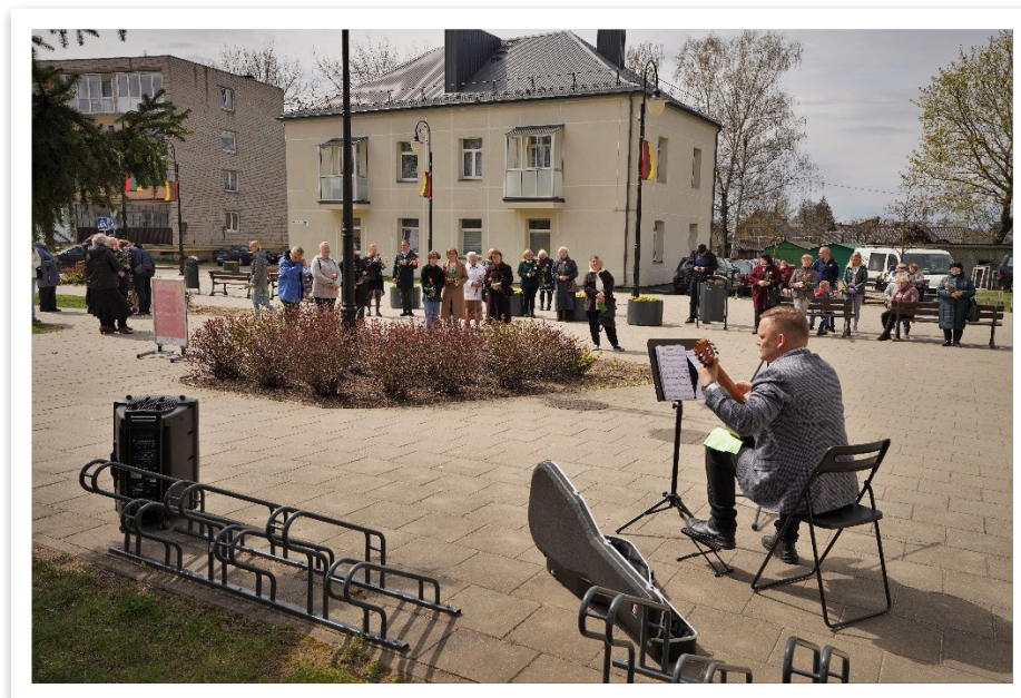
20 lentelė / paveikslas

Būtent tą dieną kvietėme mamas, močiutes bei krikšto mamas į klasikinės gitaros muzikos koncertą „Ačiū, Mama!“. Koncerto metu mamas apdovanojome ne tik gyva muzika, bet ir rožių žiedais.