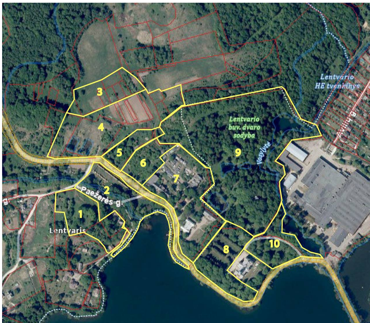
Tvarkymo plotų išsidėstymo schema