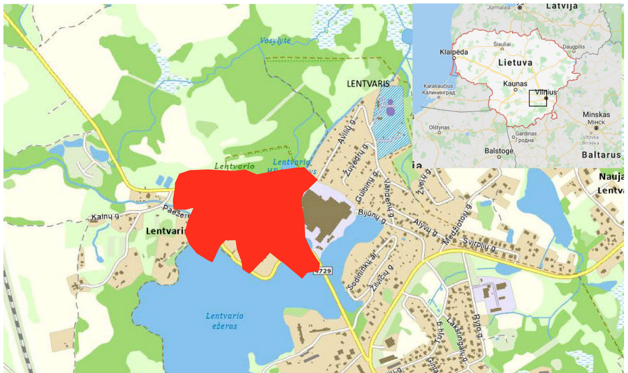
1 pav. Teritorijos padėtis Lietuvoje ir Trakų rajono savivaldybės teritorijoje (žemėlapių pagrindas iš geoportal.lt)

1.1. Teritorija, kuriai parengtas šis Sosnovskio barščio naikinimo veiksmų planas, yra Vilniaus apskrities Trakų rajono savivaldybėje, Lentvario seniūnijoje (1 pav.). Teritorija, kurioje naikintini Sosnovskio barščiai, suskirstyta į 10 tvarkymo plotus (jie aprašyti veiksmų plano 10 skirsnyje). Tvarkymo plotai išskirti atsižvelgus į invazinės rūšies gausumą, teritorijos ekologines, geomorfologines sąlygas, naudojimo pobūdį ir teisinį statusą (valstybinė ar privati žemė). Dalis tvarkomos teritorijos yra kultūros paveldo objektas – Lentvario dvaro sodybos kompleksas, kuris Lietuvos Respublikos Vyriausybės 2008 m. vasario 13 d. nutarimu Nr. 155 „Dėl kultūros paveldo objektų paskelbimo kultūros paminklais“ (Žin., 2008, Nr. 25-921) paskelbtas kultūros paminklu. Tvarkomos teritorijos centro geografinės koordinatės yra: X 566885, Y 6058906 (LKS-94 sistemoje). Visas tvarkomos teritorijos plotas – 18,50 ha (2 pav.). Iš jų valstybinė žemė sudaro 12,98 ha, o privati žemė sudaro 5,52 ha.