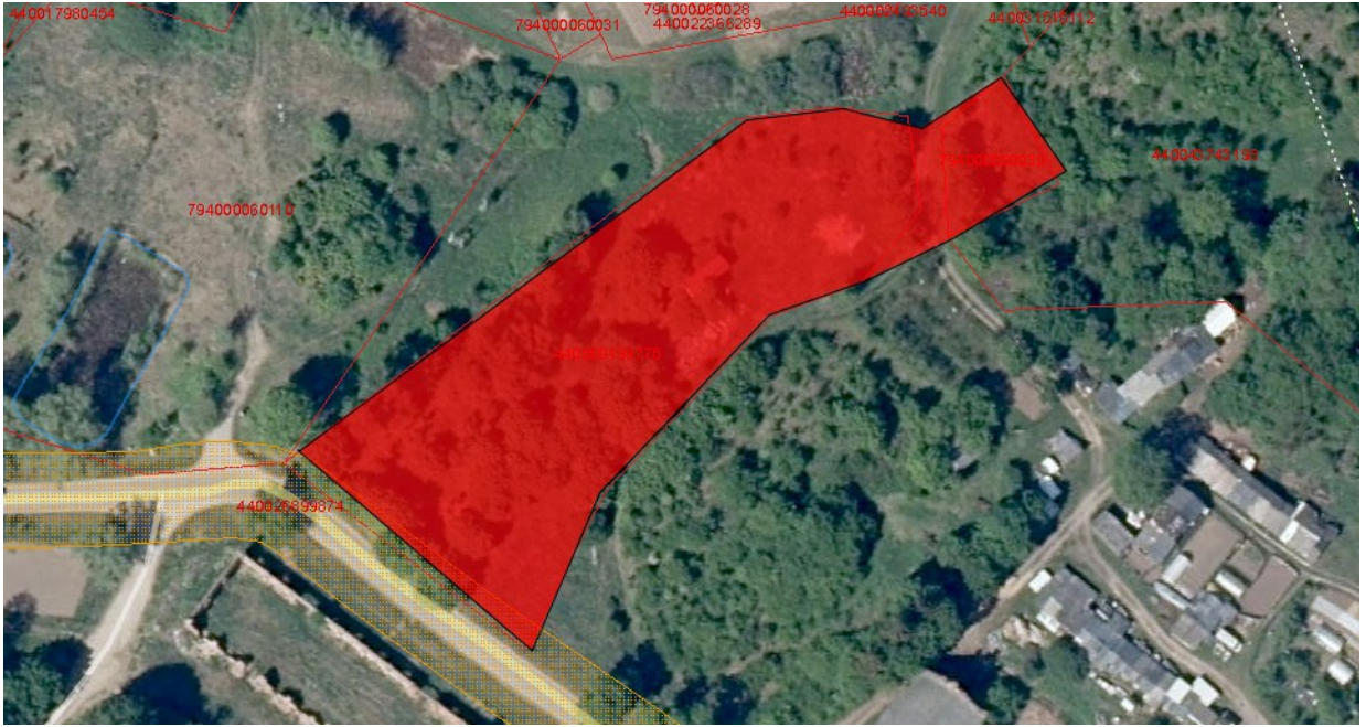
Tvarkymo plotas Nr. 5 (privati žemė)