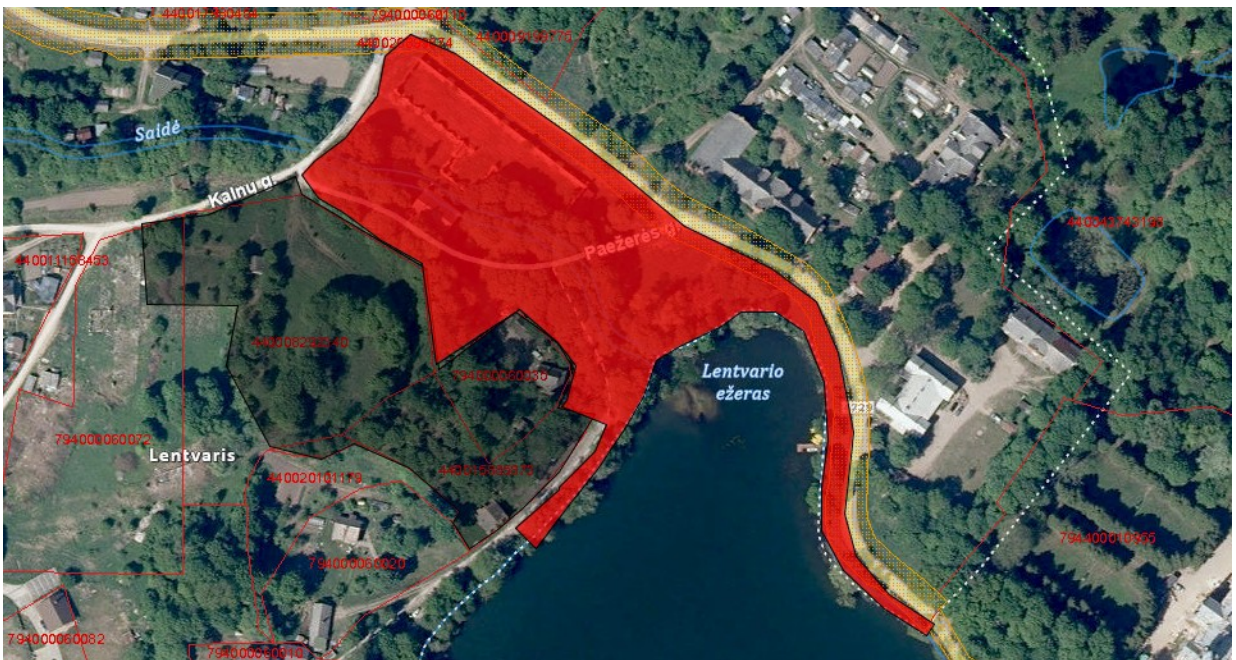
Tvarkymo plotas Nr. 2 (valstybinė žemė)