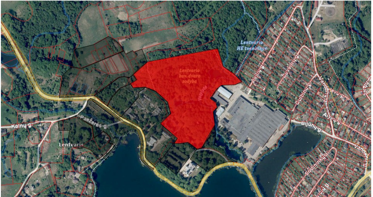
Tvarkymo plotas Nr. 9 (valstybinė žemė)