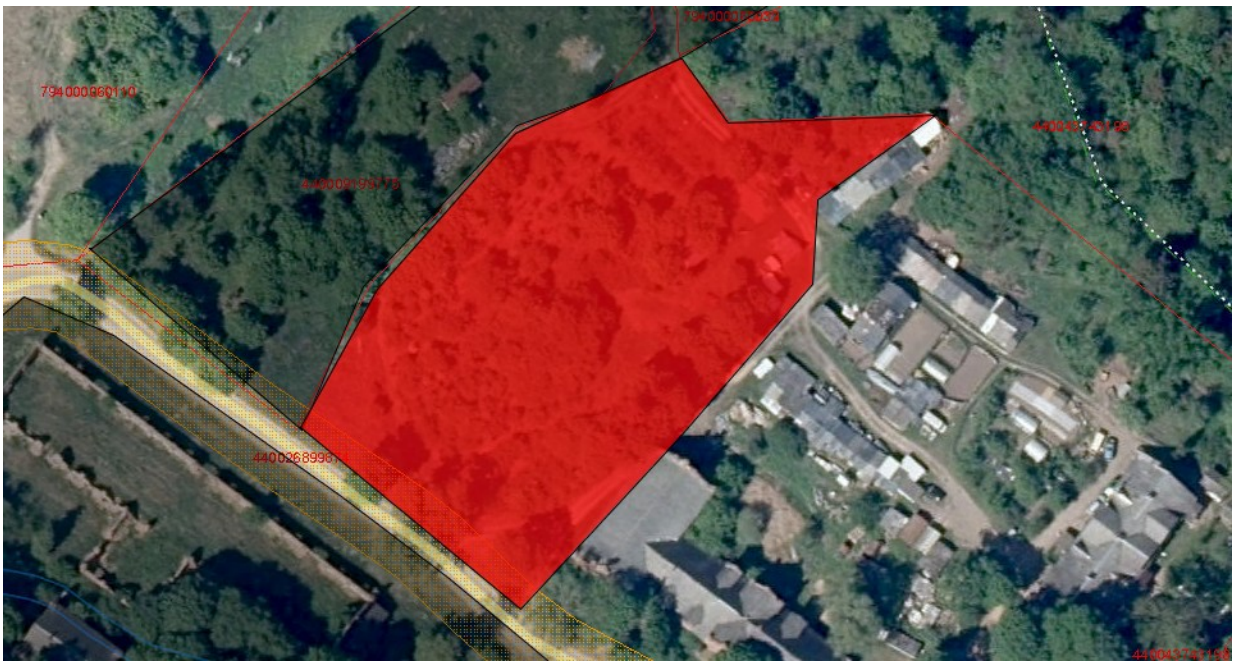
Tvarkymo plotas Nr. 6 (valstybinė žemė)