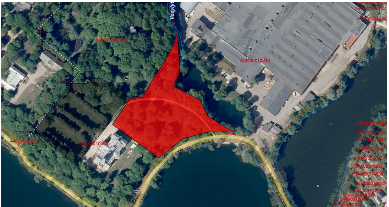
Tvarkymo plotas Nr. 10 (valstybinė žemė)