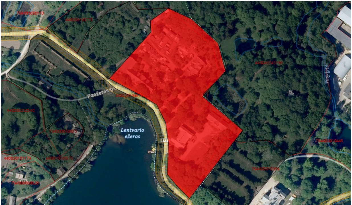
Tvarkymo plotas Nr. 7 (valstybinė žemė)