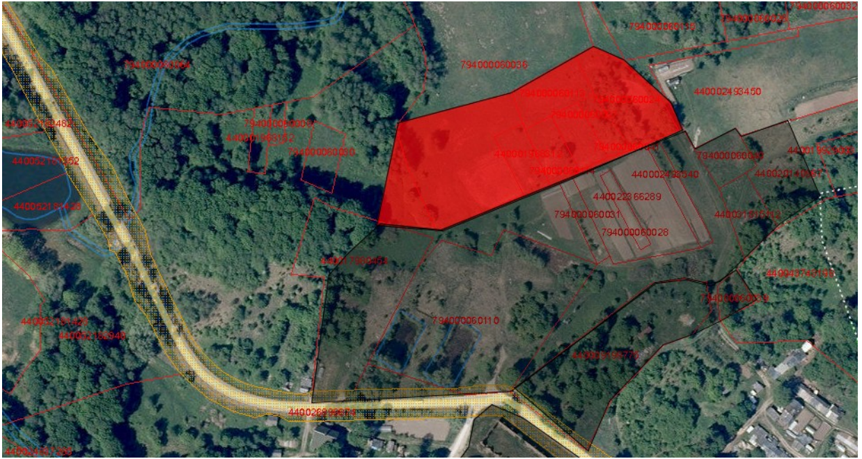
Tvarkymo plotas Nr. 3 (privati žemė)