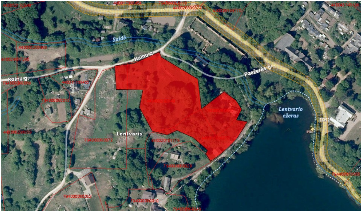
Tvarkymo plotas Nr. 1 (privati žemė)