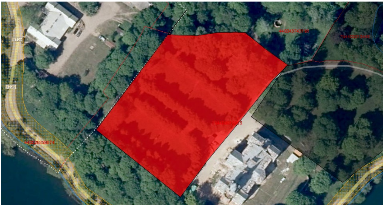
Tvarkymo plotas Nr. 8 (valstybinė žemė)