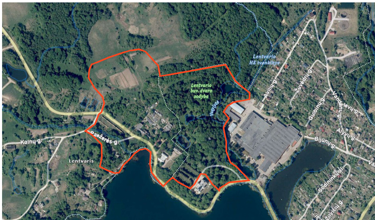
2 pav. Teritorijos padėtis Lentvareje ir jo apylinkėse (žemėlapis pagrindas iš geoportal.lt)

2.2. Sosnovskio barščio naikinimą reglamentuoja Invazinių rūšių organizmų kontrolės ir naikinimo tvarka, patvirtinta Lietuvos Respublikos aplinkos ministro 2002 m. liepos 1 d. įsakymu Nr. 352 „Dėl introdukcijos, reintrodukcijos ir perkėlimo tvarkos, invazinių rūšių organizmų kontrolės ir naikinimo tvarkos, invazinių rūšių kontrolės tarybos sudėties ir nuostatų, introdukcijos, reintrodukcijos, perkėlimo programos patvirtinimo“ (TAR, 2018-06-25, Nr. 10433).